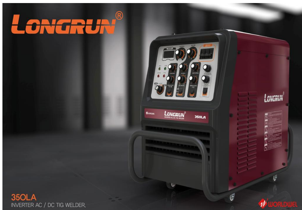
350LA INVERTER AC / DC TIG WELDER.